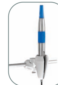
Imágenes digitales excepcionales. Un importante auxiliar para el diagnóstico.